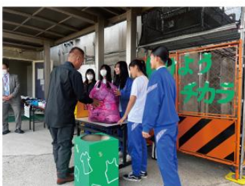
小学校での回収の様子

着の服を難民のこどもたちに贈ることができました。1月には寄贈の様子をまとめたレポートも届き、世界の人とつながることができたことも実感できました。今年も工夫を凝らしてたくさんのこども服を集めたいと思ひます。