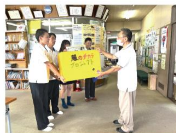
公民館での回収の様子