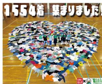
集まった服 1554 着