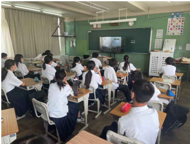
<沖縄戦についての映像を鑑賞>

8月4日(木)に全学年平和学習を行いました。太平洋戦争の沖縄戦について映像を鑑賞と「知る沖縄戦」(朝日新聞社)という新聞を中心に学び、学んだことを新聞にまとめました。(「知る沖縄戦」は生徒に渡していますのでご一読いただければと思います。)