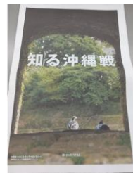
<「知る沖縄戦」 (朝日新聞社)>